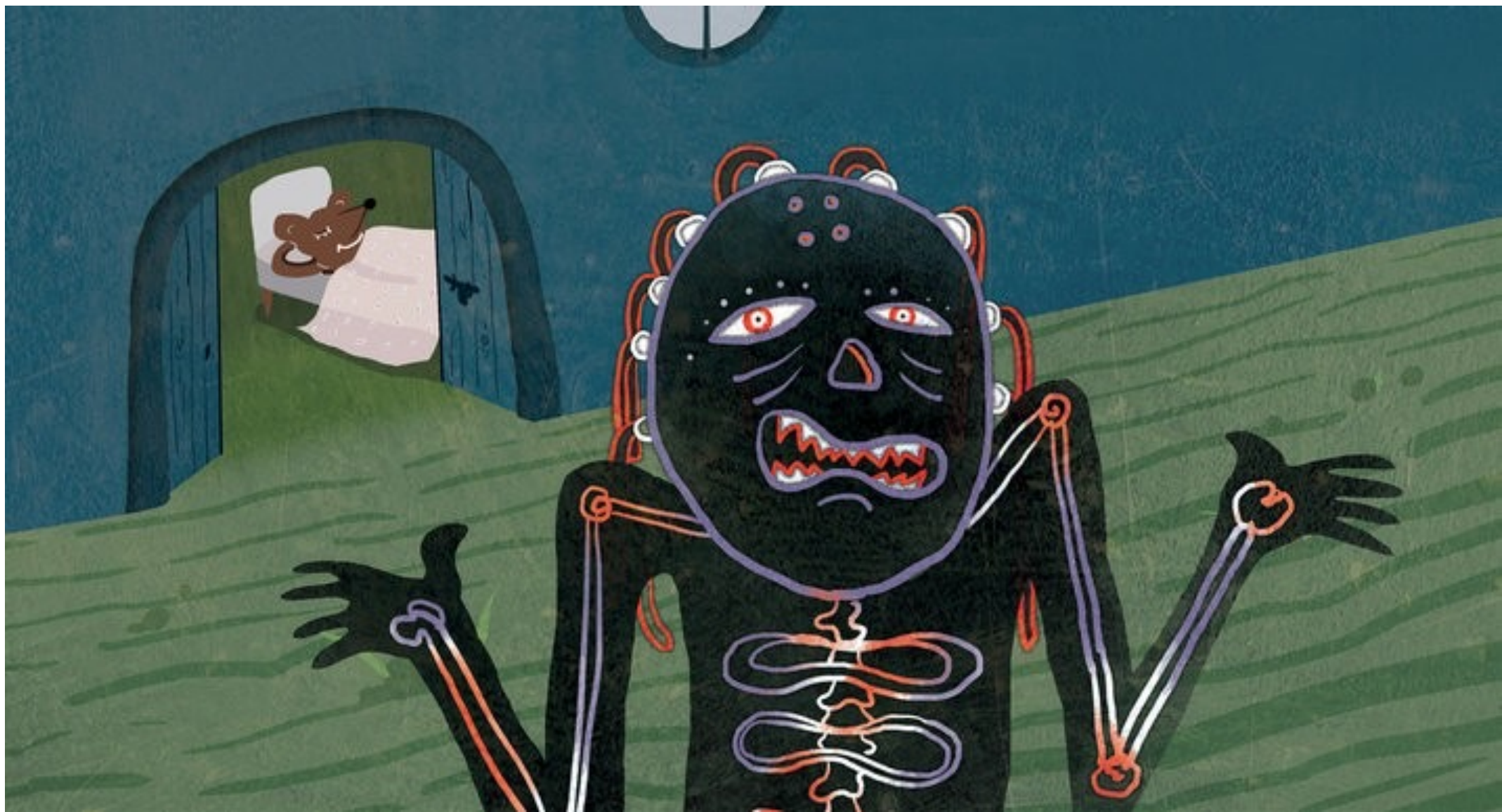
مورک خپله کمپله واغوسته او بیرته ویده شه.