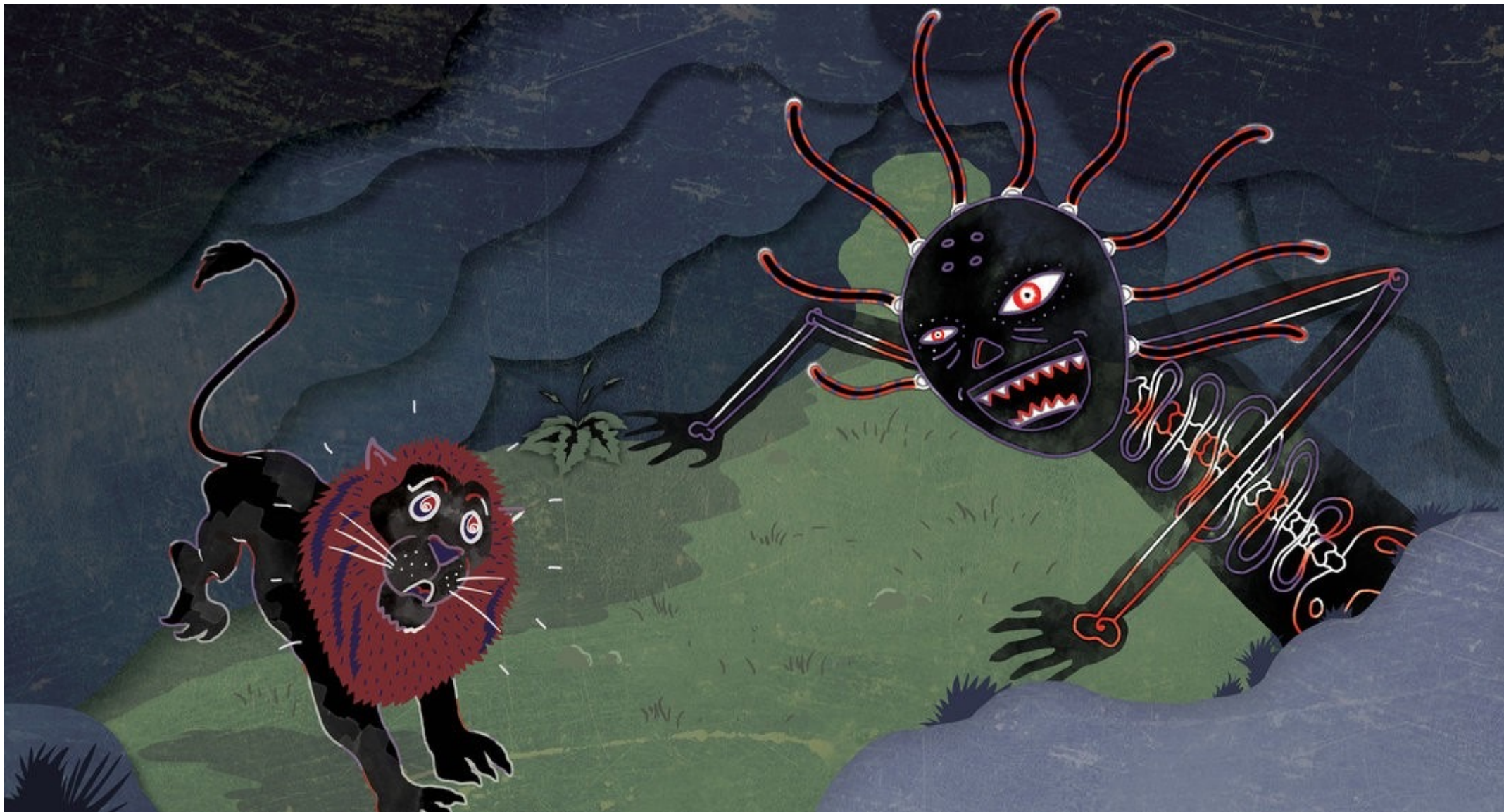
يوه ورخ هغه يو زمري و ويراوه.