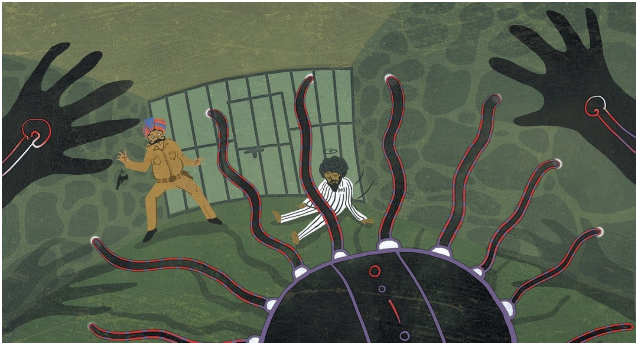
يوه ورخ وروسته يې يو بریتور پولیس و ویراوه.