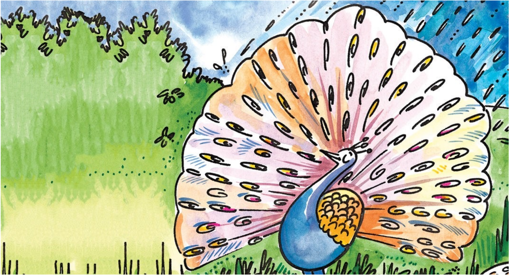
تاووس خپل بڼکي وزرونه وغورول او ونڅپد.